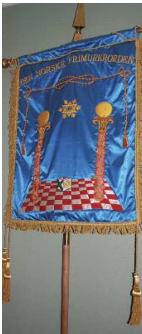
Den Norske Frimurerordens fane.

Helt sikkert reagerer man forskjellig på en slik oppnevning. Noen tenker kanskje at dette innebærer hyggelige reiser til Stamhuset uten at jeg trenger å anstrenge meg. Andre ser kanskje dette som en mulighet til å utrette noe for Ordenen og brødrene. Jeg mener bestemt å tilhøre den siste gruppen. Hovedmotivet for mitt arbeid i logen er kvalitet i alle deler av embedsverkets arbeid, til glede for den enkelte embedsmann, men først og fremst skal denne kvaliteten sørge for at brødrene har en positiv