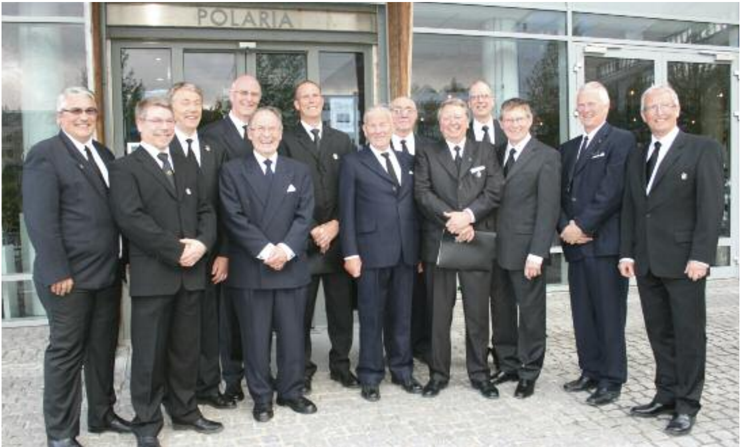
Uten musikk blir møtet fattig. Her er Tromsø Frimurerkor utenfor opplevelsessenteret Polaria i Tromsø.

Arbeidet i korene i Tromsø Provincialloge drives jevnt og trutt. Sangerne møter trofast opp til hver øving og antallet medlemmer i korene er stabilt. De aktive og engasjerte dirigentene bidrar selvfølgelig i stor grad til dette oppmøtet.