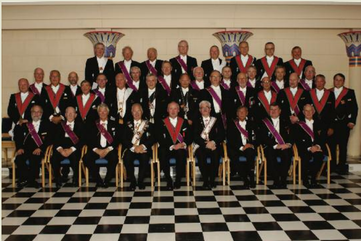
Ordenens Stormester, Provincial Mester og Ordforende Mester med kollegium og gjester.