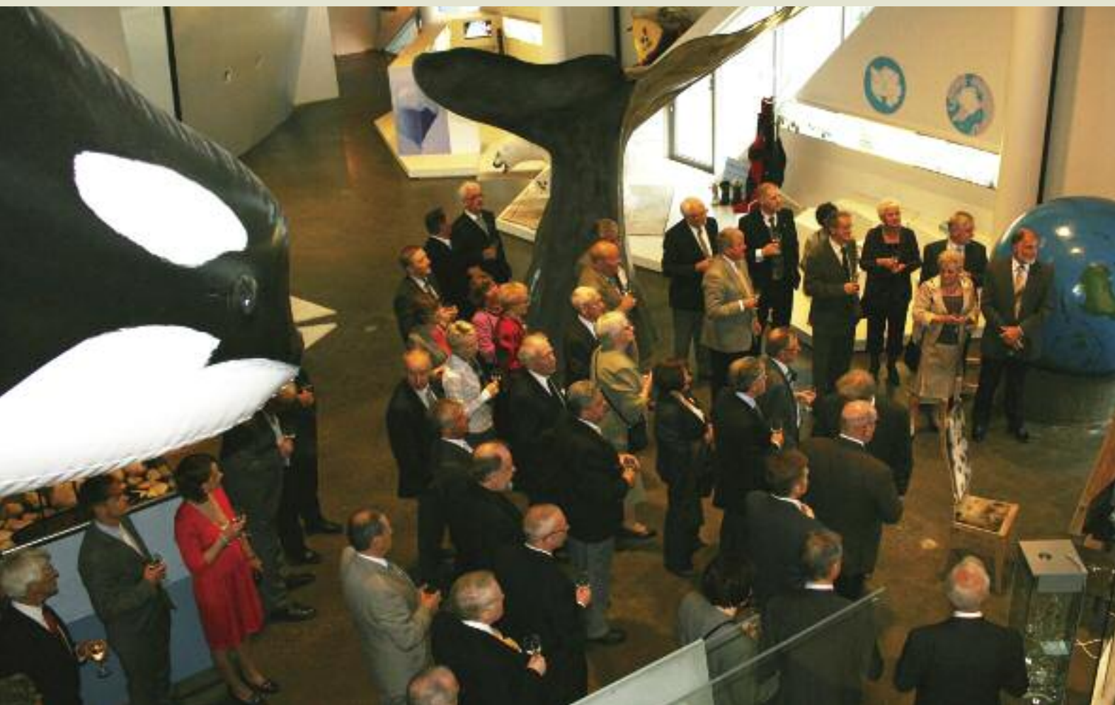
Mottagelse på Polaria.