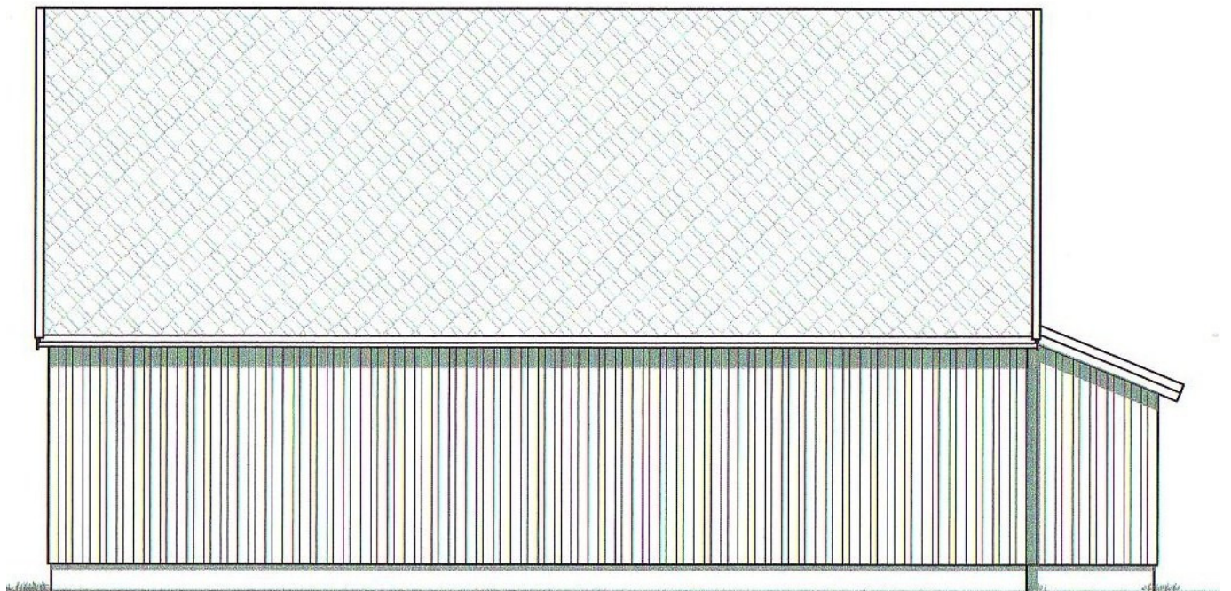
"Nybygget" - fasade mot nord