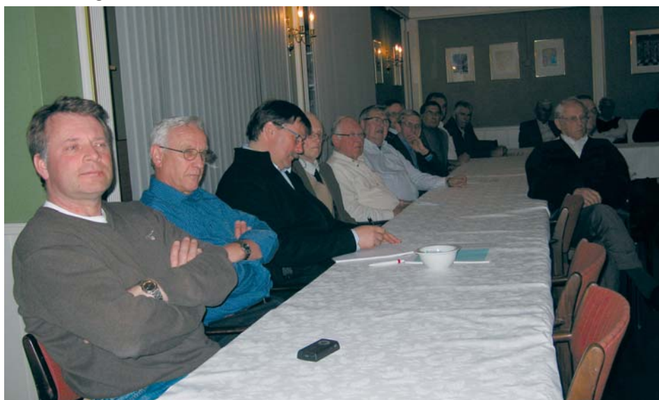
34 oppmerksomme brødre var tilstede

Det var vanlig med heftig alkoholinntak på 1600 -1800 - tallet, og logene kunne bli plaget av for mye drikking. I en protokoll fra logen Rummer Tavern i Bristol, fortelles det at det ble gitt bøter for banning og drukkenskap.