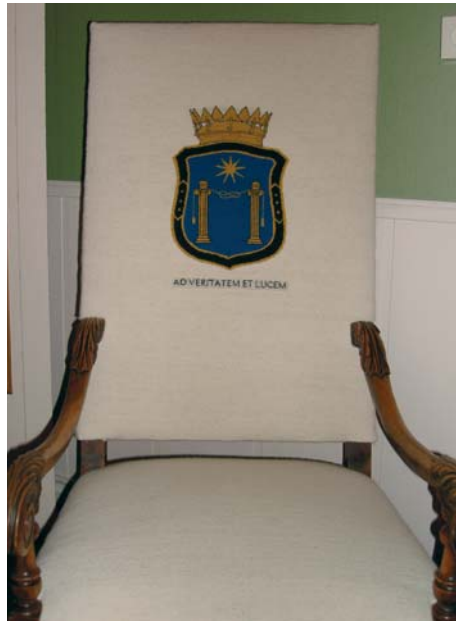
Den flotte stolen vi fikk i gave