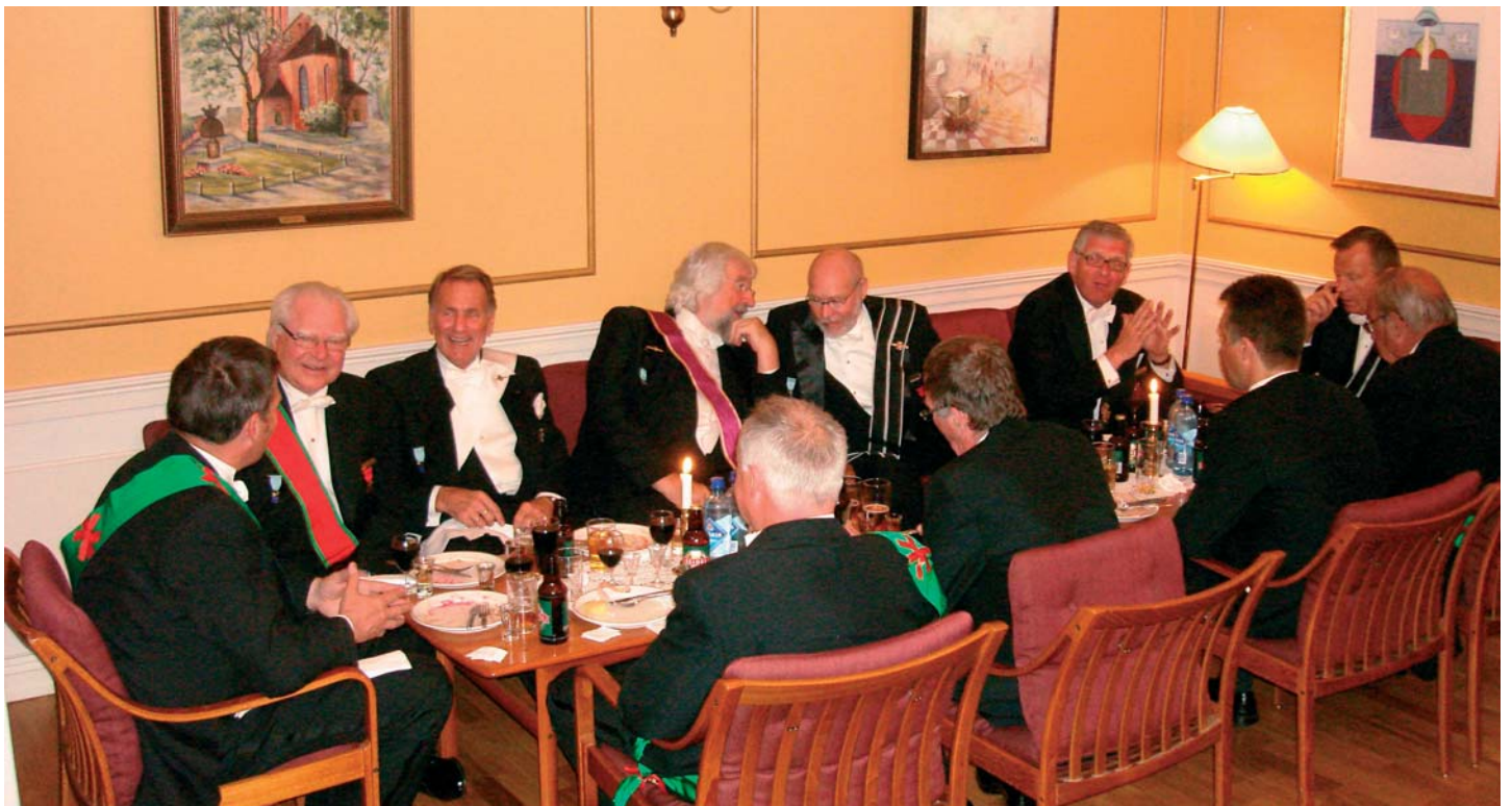
“Drøbakgjengen” la beslag på et av bordene som var dekket i salongene.