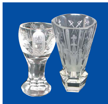
Eksempel på 2 vakre frimurerglass

Før logene fikk egne møtelokaler, holdt de sine møter i vertshus.