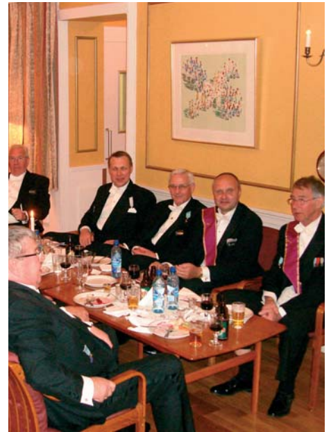
Det var mange som spiste i salongene.