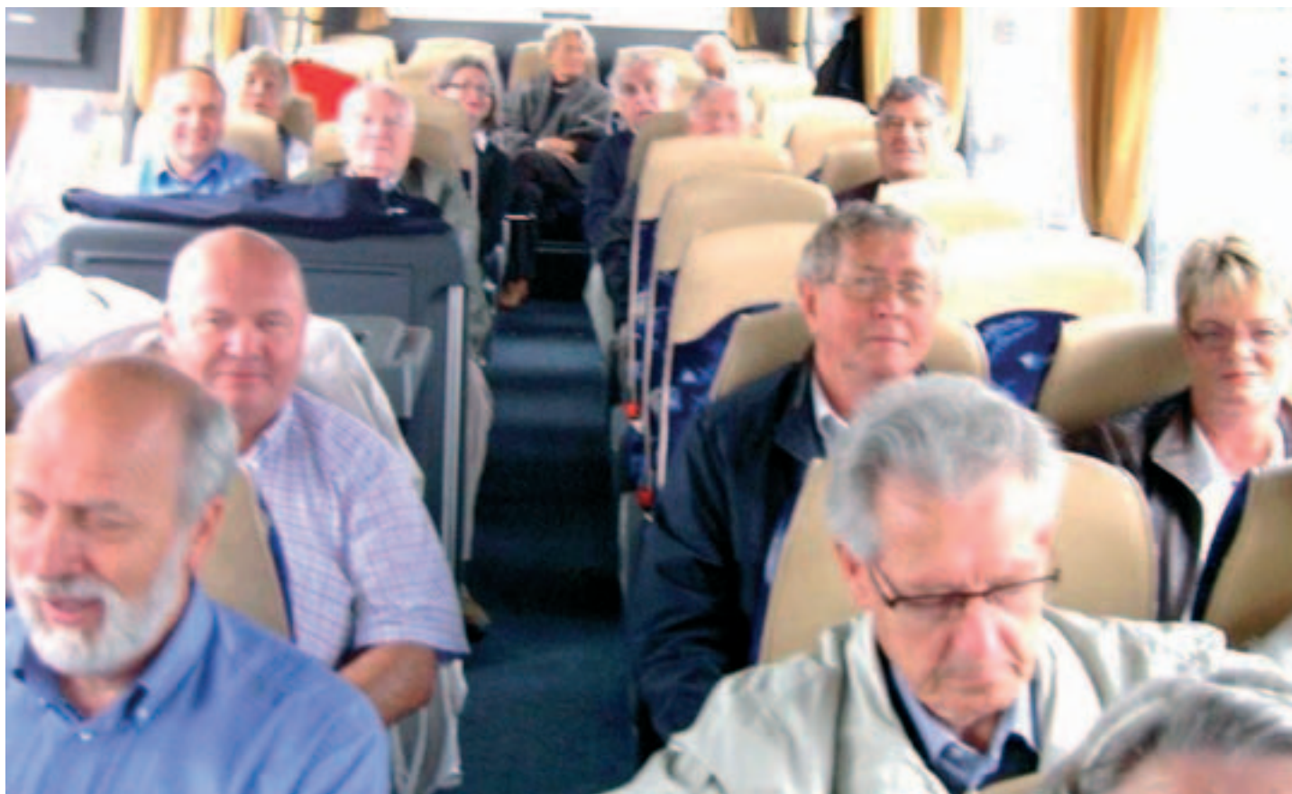
Stemningen var høy på bussen