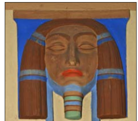
LOGESALEN III: Koblingen til det gamle Egypt er hevet over enhver tvil også ved dette ornamentelle søylehodet.