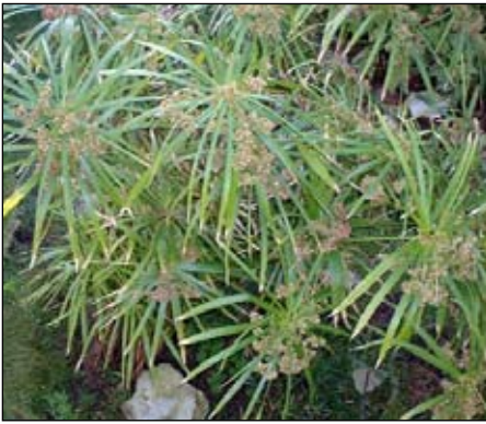
PAPYRUS: Planten var hellig for egypterne, og ble brukt til mye annet enn bare å skrive på.

Når vi ser på søylene som omkranser logesalen i sør og i nord, ser vi øverst de åpne blomstene som strekker seg mot himmelen, og litt lenger ned lukkede knopper, et tegn på visdom og styrke mot de kalde og ødeleggende vinder som kom fra nord, og som kunne bety dårlige avlinger og uår for Egypt.