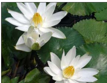
LOTUSGUD: Lotus inspirerte egypternes søyler, som det fremgår av denne illustrasjonen.

Lotusen er en blomst som finnes i flere varianter både i Afrika og Østen. I gammel tid i Egypt fantes det to opprinnelige typer av lotusblomsten, den hvite ( Nymphaea lotus ) og den blå lotusen ( Nymphaea cerulea ). En tredje type, den rosa lotusen ( Nelumbo nucifera ) har sine opprinnelser i Østen og ble etterhvert innført fra Persia.