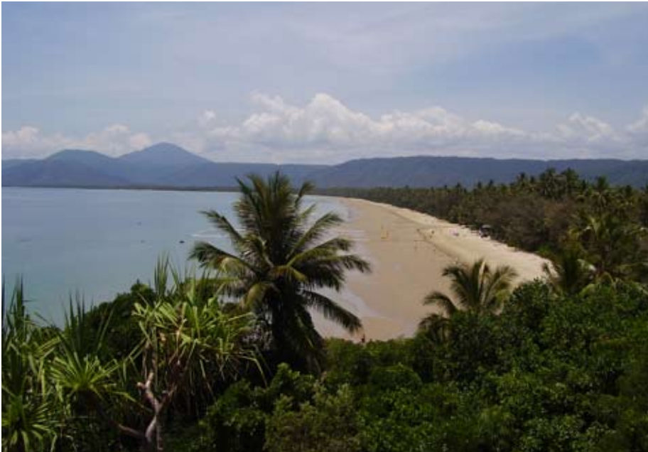
AUSTRALIA: Til tross for de mange brannene var det heldigvis også idyller som denne å se. Bildet er tatt ved kysten sydvest for Melbourne.

Årets utenlandsferie gikk til Australia med familiebesøk i Melbourne. Gjennom min fetter fikk jeg også anledning til å besøke The Grand Lodge of Victoria.