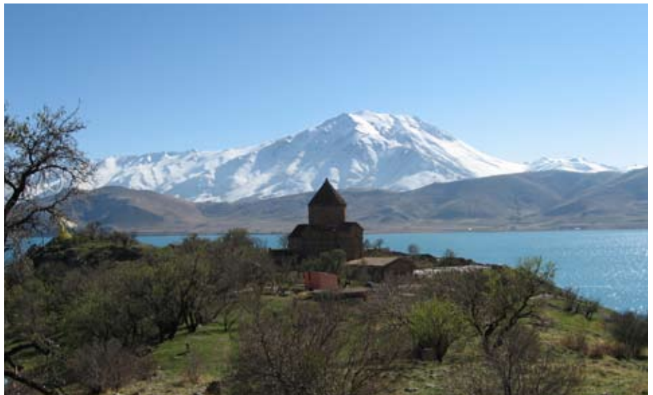
HELLIGDOM: Det hellige kors' katedral på øya Ahtamar i Vansjøen i dagens Øst Tyrkia.