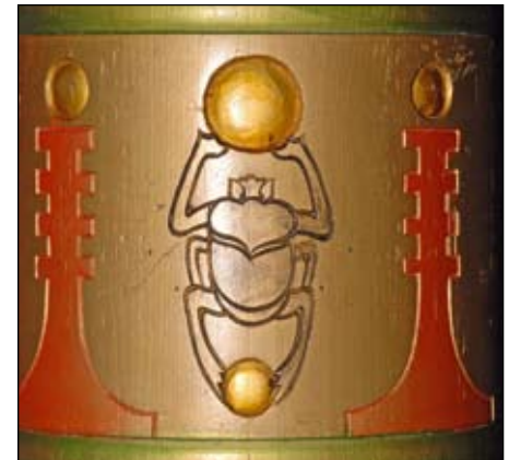
LOGESALEN II: Skarabeen dukker opp på flere steder i vår logesal.