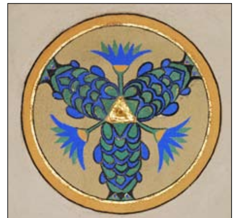
LOGESALEN IV: Her er det papyrus som har vært inspirasjonskilden ved utsmykningen.