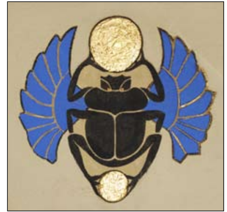
LOGESALEN I: Scarabeen symboliserte gjenfødelse for de gamle egypterne.

Vi har nå sett nærmere på en del av de dekorasjoner som gjør vår sal så egyptisk. Vi kan se hvordan våre søyler langs veggene møter himmelhvelvingen i likhet med de egyptiske templene, og også vi har et inngangsparti, en forgård og et symbolsk indre tempelrom. Dette betyr dog ikke at vi benytter et tempel etter egyptisk modell i vårt frimureriske arbeid, selv om det kan se slik ut. Her må vi se klare skiller mellom hvordan salen er utformet ut fra dekorative hensyn, og hvordan salen er innredet som logerom.